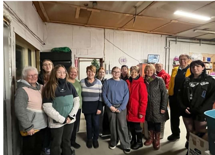
Leo et Lions

Les Léopards étaient enchantés par l'expérience, ils ont semé la joie sur leur parcours.